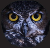
Heel grote ogen

Er zijn dieren die 's nachts heel goed kunnen zien. Ze hebben heel grote ogen of een soort spiegelogen. Met die ogen vangen ze al het licht dat er is.